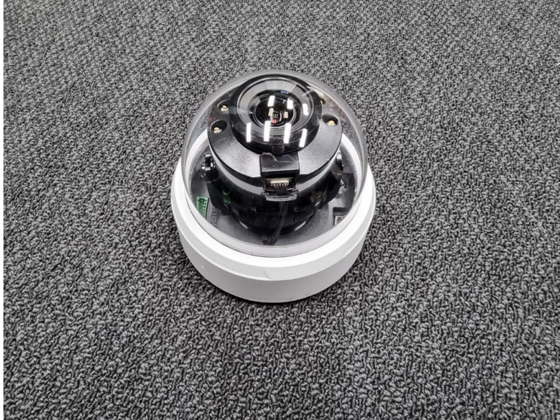
< 사진 1. 정면 >

본 시험성적서의 진위확인은 DocuQR 홈페이지 및 애플리케이션에서 가능합니다.