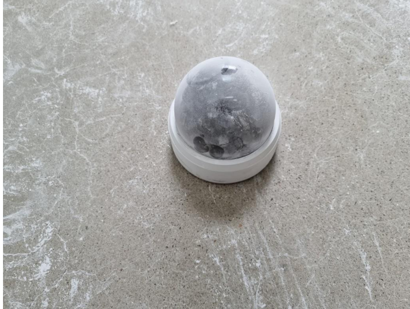
<IP5X 시험 후 외관>