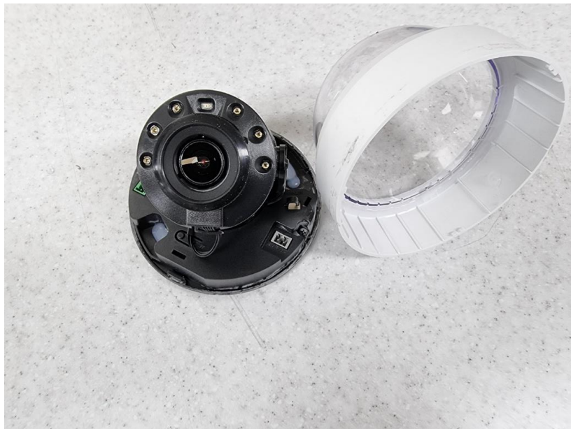
<IP5X 시험 후 내부>

※ 시험 후 기기내 먼지 침투 있으나, 운전을 방해하거나, 안전을 해치지 않음