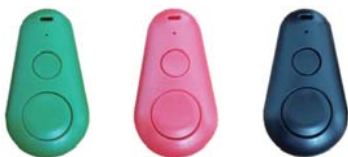
BLE Button (Bluetooth Button)